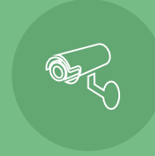
كاميرات مراقبة Surveillance Camera