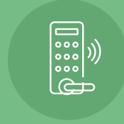
دخول ذكي Smart Entrance