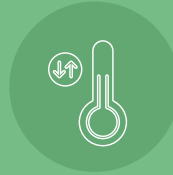
حساس جو Atmospheric Sensor