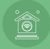
نظام تحكم ذكي Smart Control System