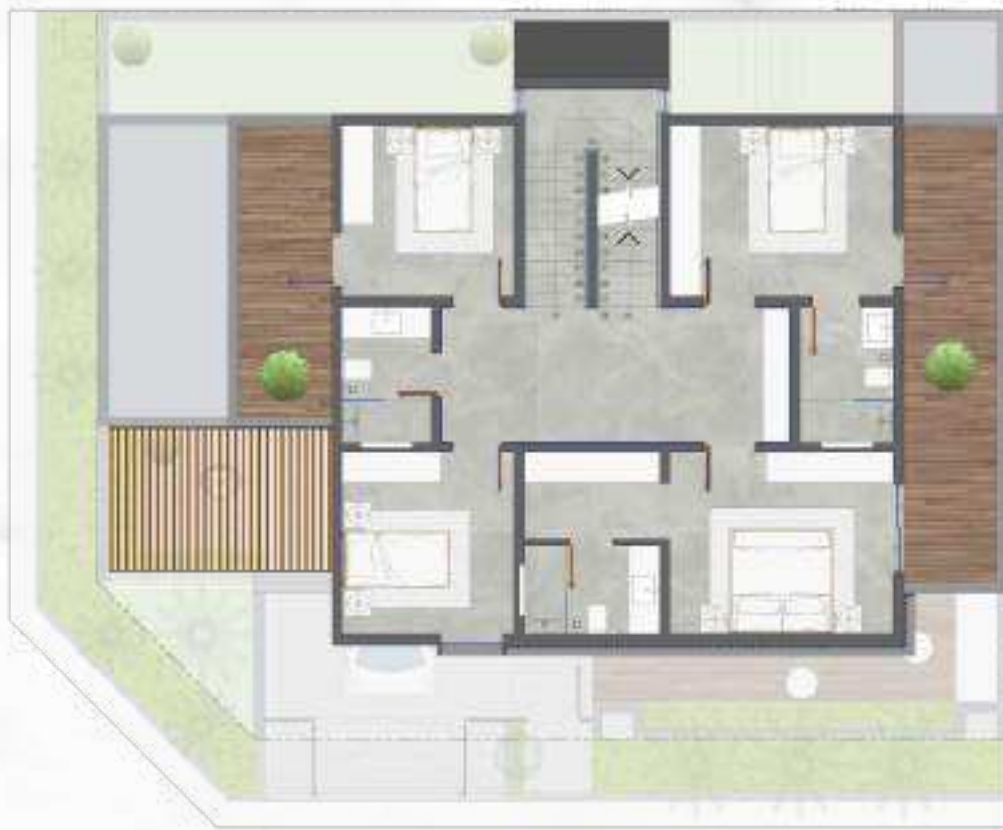
الدور الأول | فيلا الزاوية First Floor | Corner Villa