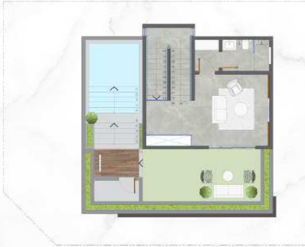
الدور العلوي | فيلا الزاوية Second Floor | Corner Villa