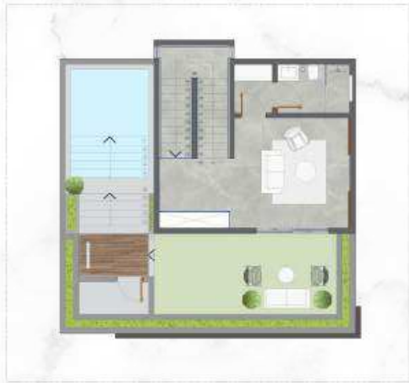
الدور العلوي | الفيلا العادية Second Floor | Regular Villa