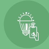
إضاءة ذكية Smart Lighting