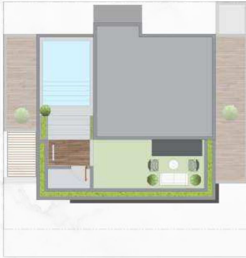
المخطط العام | الفيلا العادية Master Plan | Regular Villa