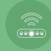
مستشعر حرارة Temperature Sensor