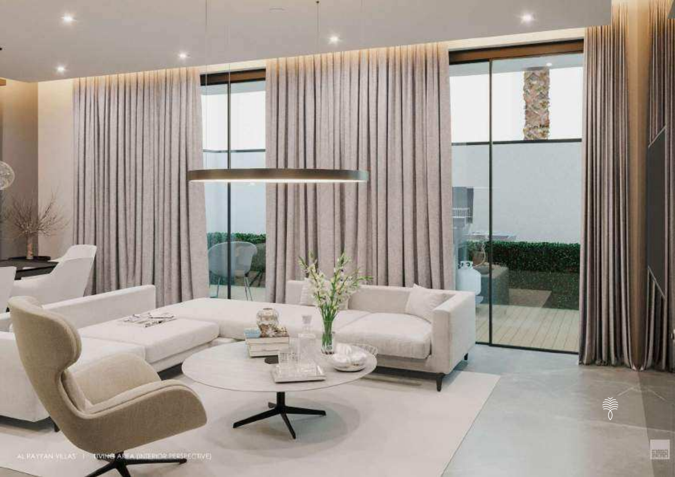
AL PATTAN VILLAS | (LIVING AREA INTERIOR PERSPECTIVE)