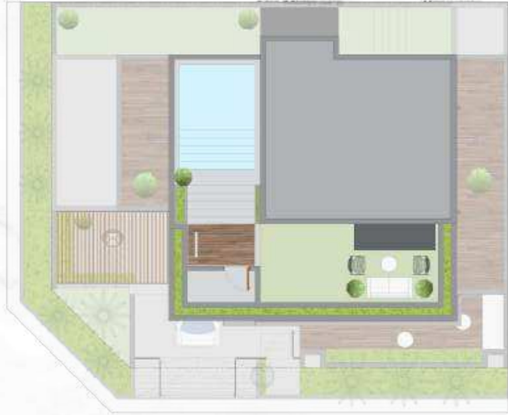
المخطط العام | فيلا الزاوية Master Plan | Corner Villa