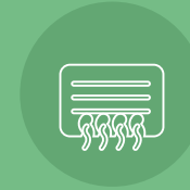
مكيفات مخفية Concealed air conditioners