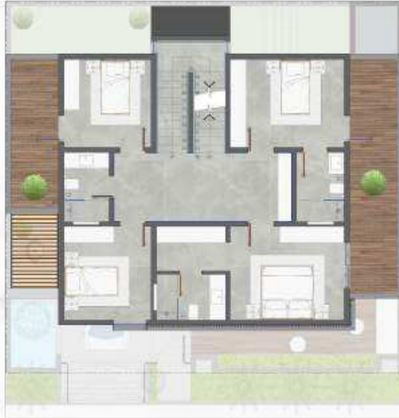
الدور الأول | الفيلا العادية First Floor | Regular Villa